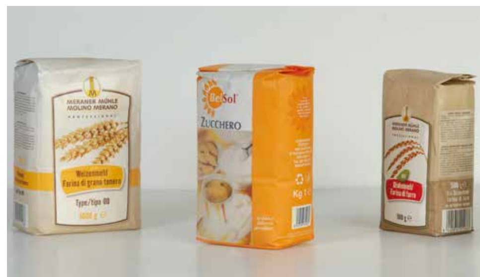
Dimensioni sacchetti confezionati dalla macchina Sacs de taille emballé par machine Size bags packed by machine