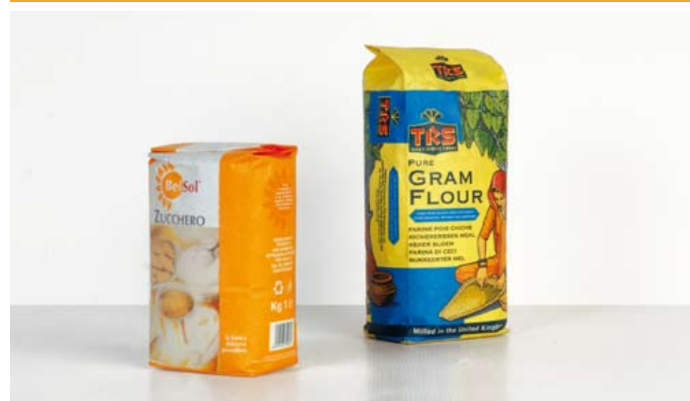
Esempio di sacchetti confezionati dalla macchina Exemple de sacs emballé par machine Example of bags packed by machine